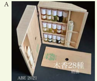
実物サンプルと配付資料

耳アカ縄文DNA__漆ヌルゲ耐性、デスクワーク面積(知的向学ライフ)、睡眠の質・住まいの匂い等。